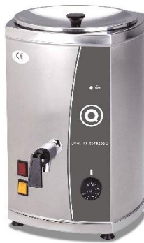
TERMO LECHE SIN BASE