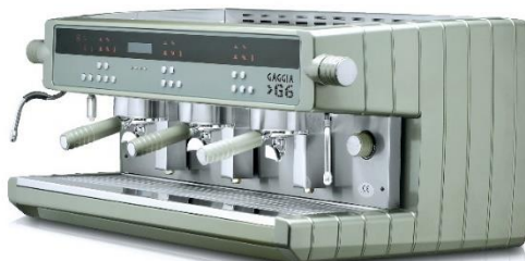
G6 ELE 3GR DISPLAY