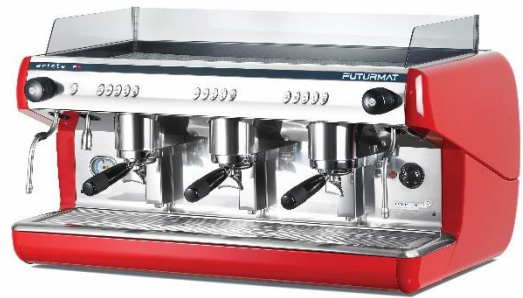
F3 ELE 3GR