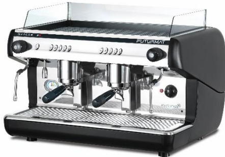
F3 ELE 2GR

Versiones con sonda de temperatura en la lanza de vapor disponibles.