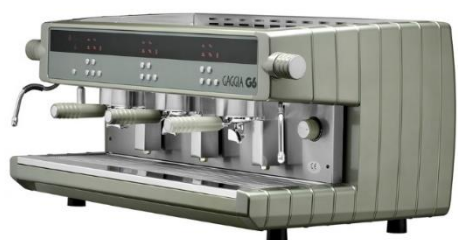
G6 ELE 3GR

Regulador de temperatura del agua caliente para infusiones entre 85 y 98° ; Renovación automática del agua de la caldera pulsando un botón; Dosificación programable de la cantidad de agua para infusiones; Sistema elevador de la bandeja para facilitar el desmontaje de los laterales sin necesidad de retirar las tazas; Panel de mandos de vidrio templado con serigrafía vitrificada, totalmente integrada en el frontal de la máquina; Nuevo grifo de rápida apertura Easy Latté® que facilita la emulsión de la leche para elaborar cappuccinos.