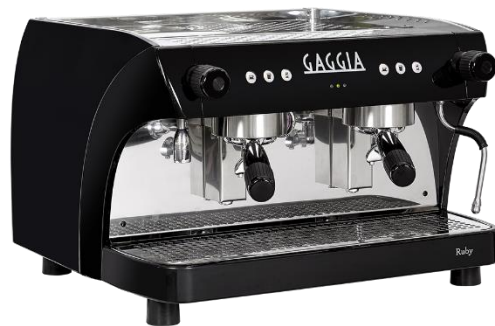
RUBY PRO TWO