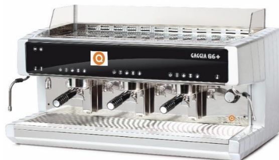
G6+ ELE 3GR