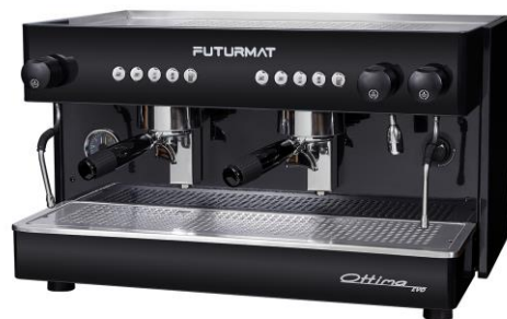
OTTIMA EVO 2 GRUPOS