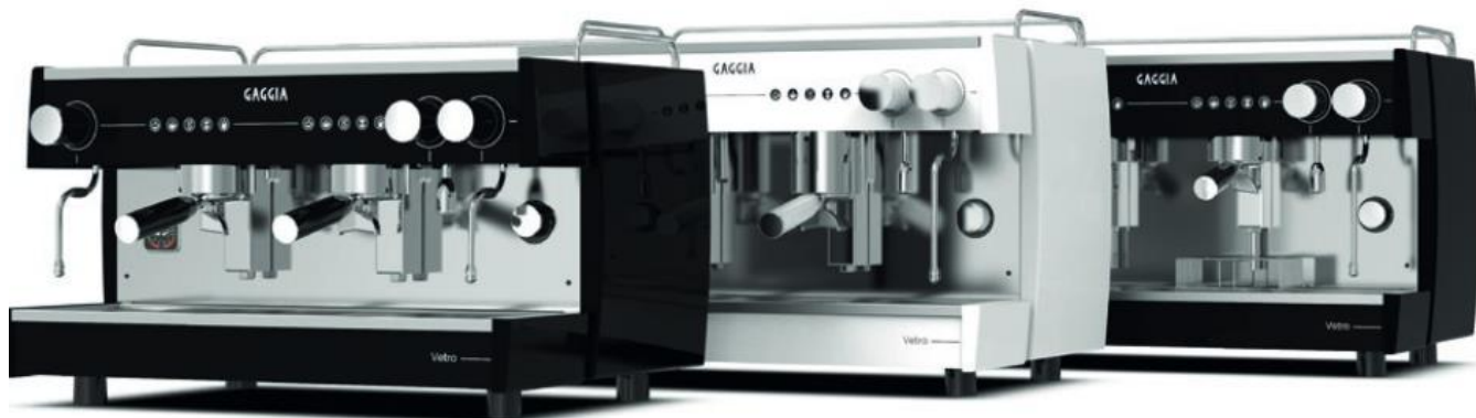
VETRO ELEC 2GR

Versión con chasis XL para locales con más consumo de lo habitual