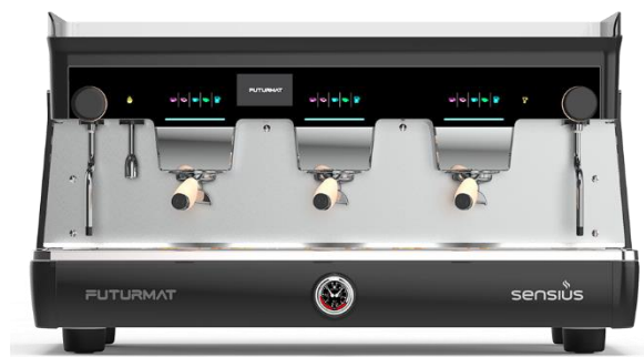
SENSIUS GOLD 3GR