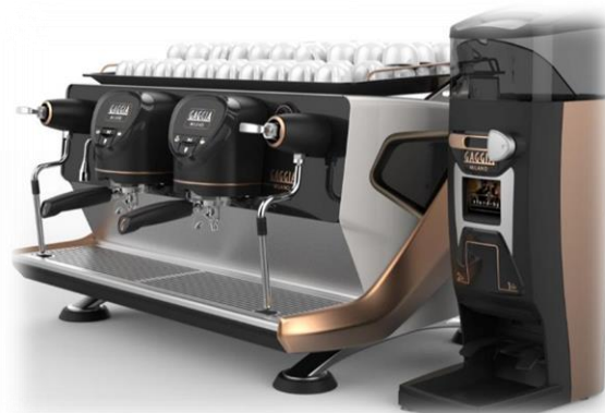
LA REALE + G10