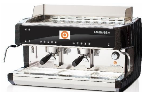
G6+ ELE 2GR

Versiónes con sonda de temperatura para la lanza de vapor disponible.