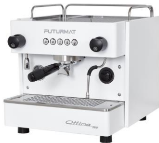
OTTIMA EVO 1 GRUPO