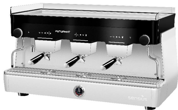
SENSIUS ELEC 3GR