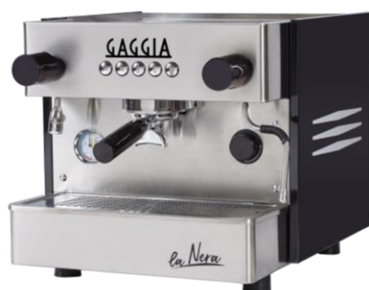
LA NERA 1G