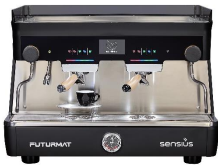
SENSIUS GOLD 2GR TALL