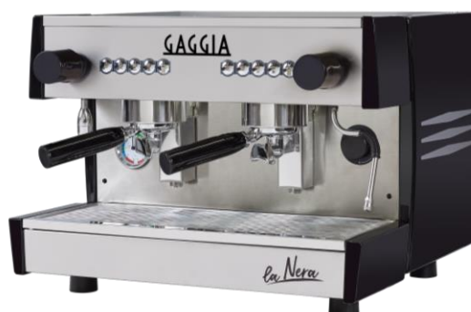
LA NERA 2G COMPACT