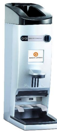
MOLINO Q10 + ADAPTADOR LATAS