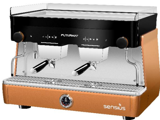
SENSIUS ELEC 2GR