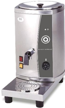
TERMO LECHE CON BASE